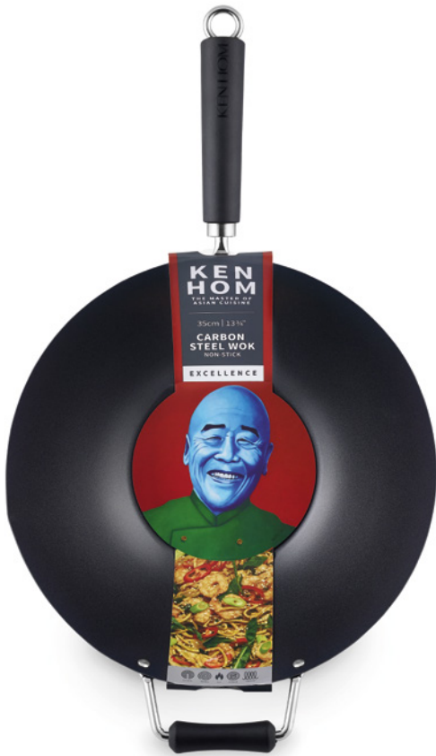
KH435001 35cm Non Stick Carbon Steel Wok