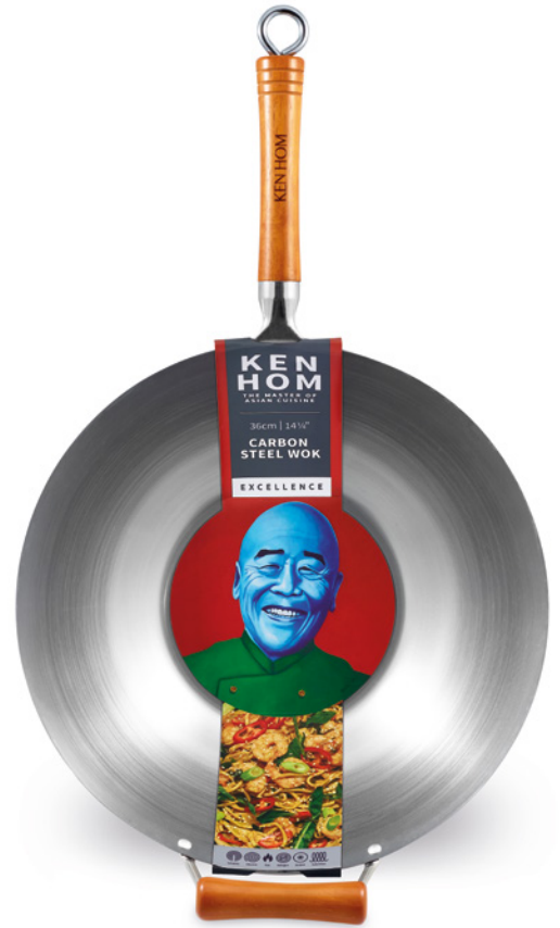
KH436003 36cm Carbon Steel Wok