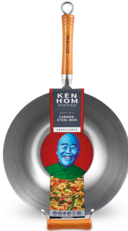
KH432003 32cm Carbon Steel Wok